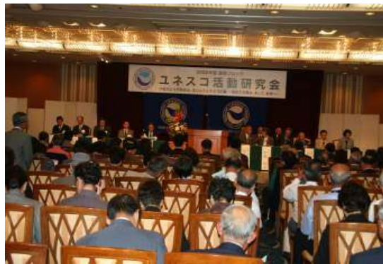
ユネスコ活動研究会 IN 群馬

その後、ユネスコ青少年活動としての茨城県ひたちなか市阿字ヶ浦中学生6名による「自然保護活動に関する報告」などのプレゼンテーションなど行われました。