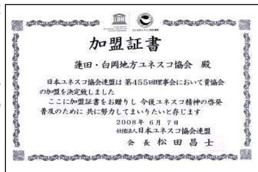
日本ユネスコ協会連盟への加盟証書