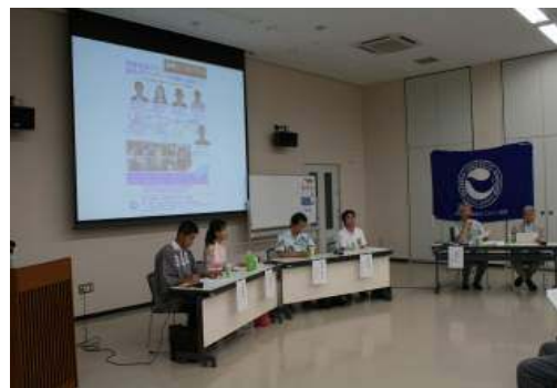
4人のパネラーとコーディネーター