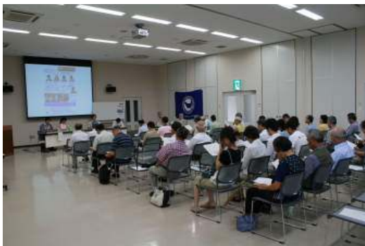
シンポジウム会場

また、私たちの町にこのような経験をされた方がおられる事を知る素晴らしい機会でした。